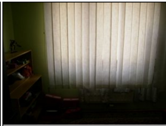
Detska izba 2