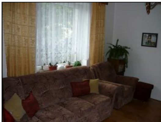
Obyvacia izba 1