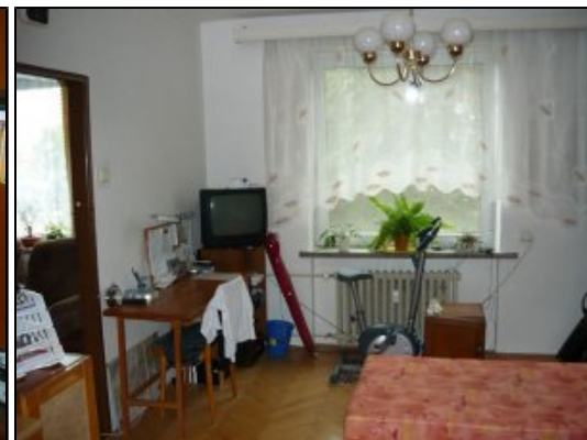
Izba s vyklenkom